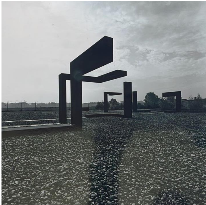
André Volten, zonder titel, gedateerd 1976-19, Evides Rotterdam