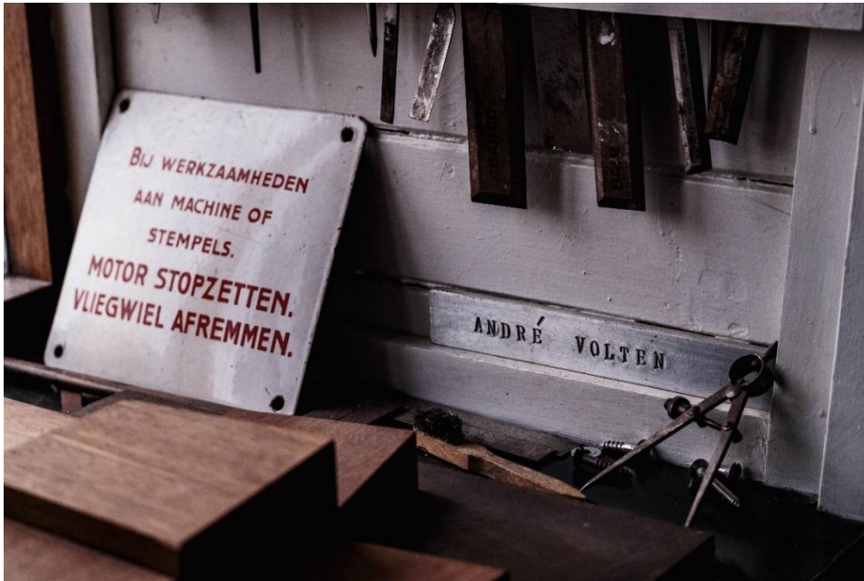
Detail interieur Atelier Volten, foto: Ivo Jeukens

het Aster-gebied (het gebied tussen de Asterdwarsweg, de Distelweg, de Chrysantenstraat en de Asterweg) dat de gemeente heeft bestemd met een culturele functie.