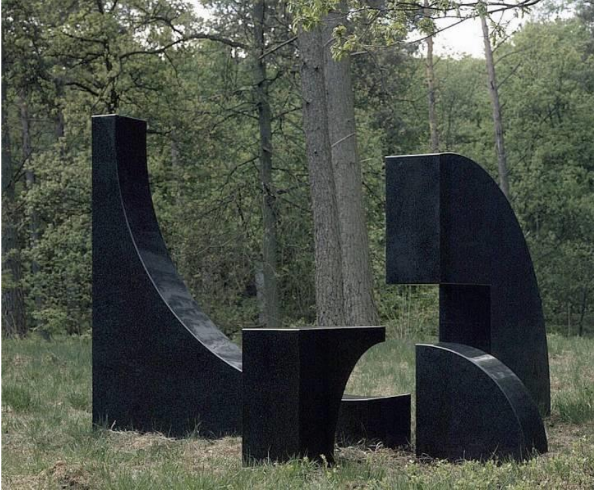
1 : 4 = 4 X 1, 1986, Beeldentuin Kröller Müller Museum